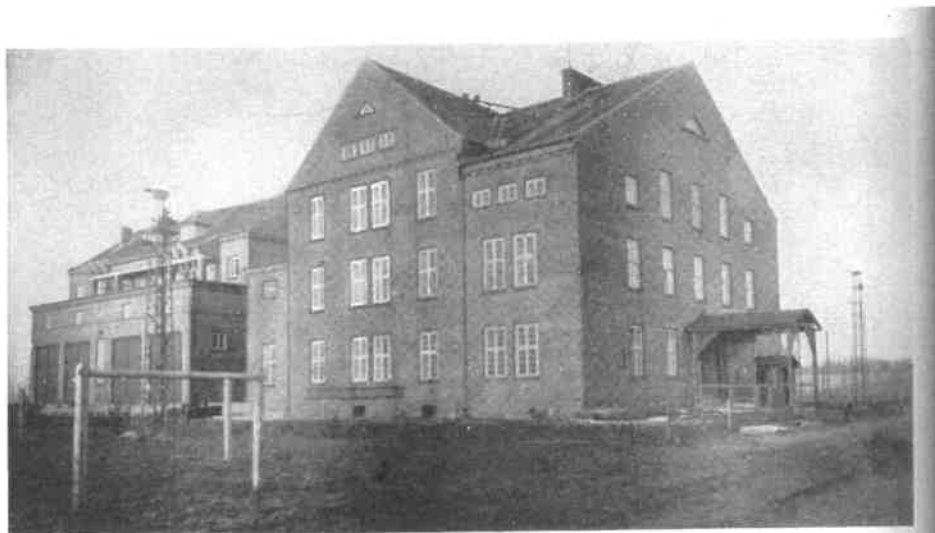
Umspannwerk Elbing des Ostpreußenwerks 60 000/15 000/6 000 Volt

Główny Obiekt objęty opracowaniem został wybudowany w roku 1924. Obiekt ten był Główną Stacją Transformatorową Prus Wschodnich uruchomioną na węźle sieci 60 kV (fot.3). Część elektryczna została wykonana przez Zakłady Siemens. Rozdzielnia ta, stanowiła następnie część Elektrowni parowej uruchomionej w Elblągu w 1928 r. (fot.4)