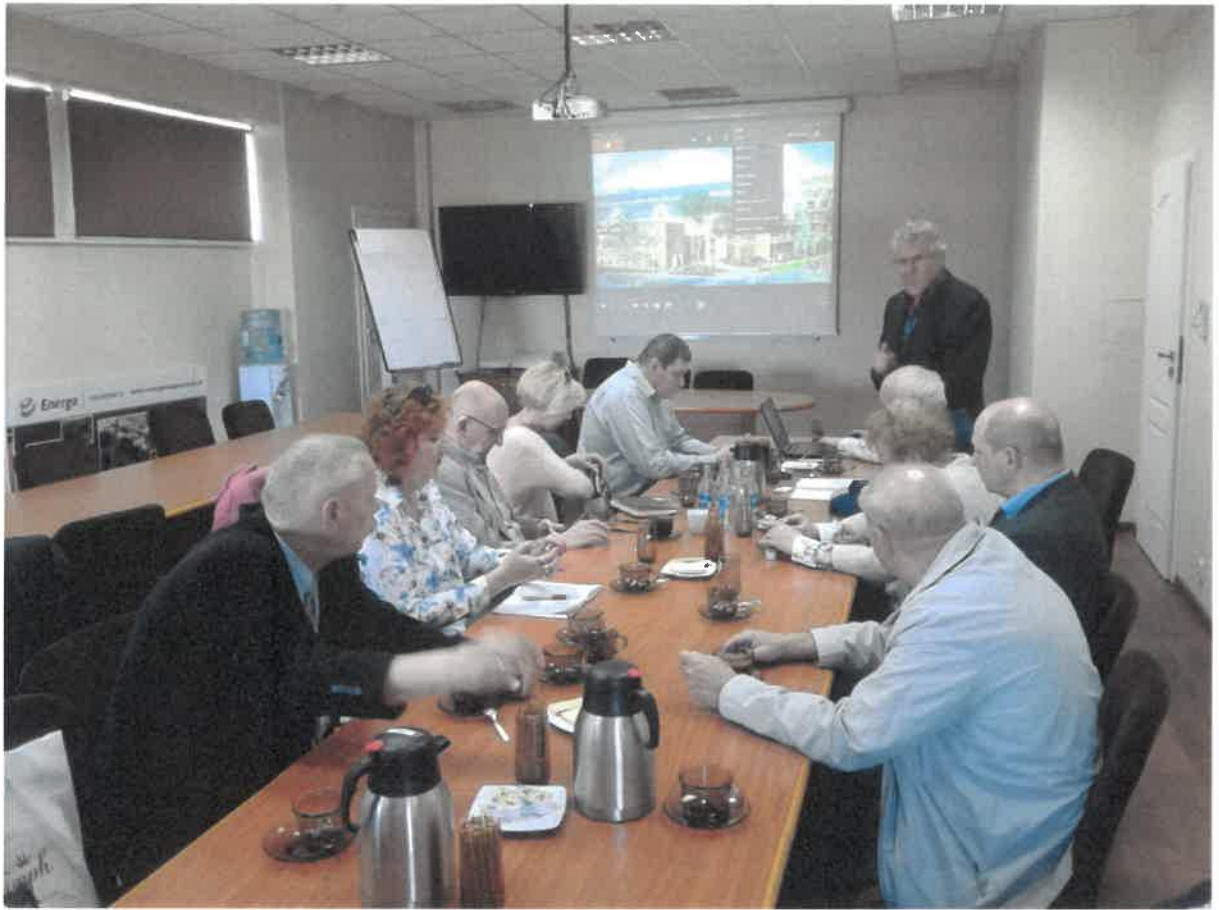
Fot. 1 Kol. Zbigniew Lange