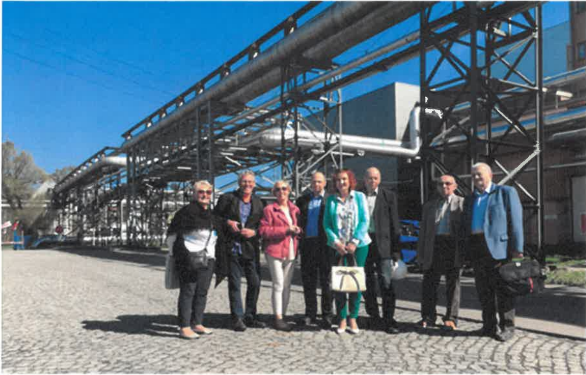
Fot.5 Uczestnicy spotkania