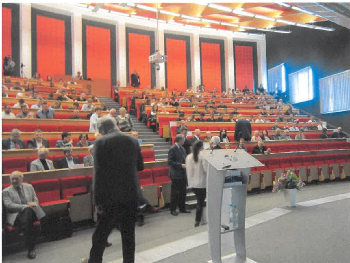
Fot.1 Aula PWSZ w Elblągu